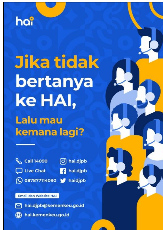
Gambar 2-1 Contact Center HAI DJPb

Jika ada kendala dalam penggunaan aplikasi, silahkan hubungi KPPN Mitra Kerja atau HAI DJPb.